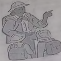
Ізюмський міський центр соціальних служб для сім'ї, дітей та молоді

Ст. 42 Всі діти мають право знати свої права держави зобов'язана якнайширше захищати як дорослих так і дітей з їх правами, відображеними у конвенції ООН про права дитини.